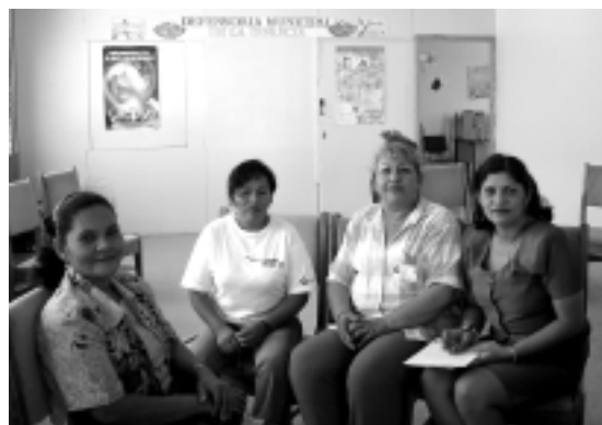
Local government members and representatives of CEM-H in the Municipal Women's Office in Nacaome, Honduras

Las alianzas entre mujeres y hombres progresistas en cargos políticos oficiales y oficiosos (incluidas las mujeres que componen movimientos feministas y de mujeres) también han resultado productivas en este aspecto. Por ejemplo, vinculando a las mujeres en la política formal, el Programa de establecimiento de redes de género de Tanzania ha conseguido notables modificaciones de las leyes relacionadas con derechos civiles, violencia sexual y derechos a la tierra de dicho país.