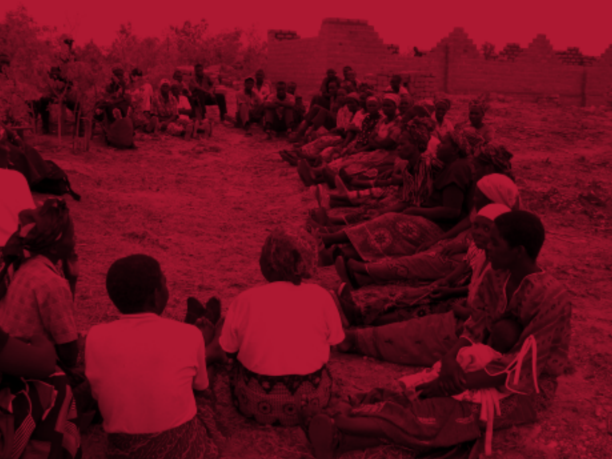
Miembros de organizaciones de mujeres comunitarias y representantes de la organización Women for Change (Mujeres para el Cambio), hablando sobre el éxito de su candidata en la elección municipal de Madzubuka, Zambia