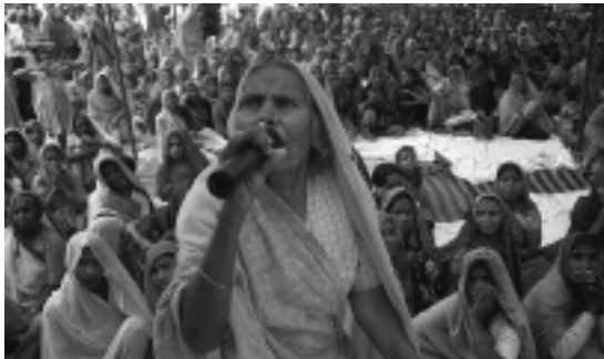
Líderes comunitarias presentando su agenda a representantes del gobierno local y del gobierno nacional, PRIA, India

Los actos críticos, incluido el debate de ‘temas de mujeres’ en el Parlamento y la promoción de una política sensible al género, pueden deberse a una serie de factores como los vínculos de los parlamentarios con grupos y movimientos de mujeres y feministas, el apoyo de las organizaciones de la sociedad civil relevantes, las ideologías más abiertas de los partidos políticos dominantes y la procuración internacional respecto a temas concretos. Se pueden formar espacios seguros para la defensa y la acción sensible al género en estructuras políticas oficiales cuando las parlamentarias que comparten perspectivas políticas llegan a alcanzar una minoría en un partido concreto. También se pueden crear a través del desarrollo de alianzas entre las mujeres que trabajan en distintos partidos políticos o en las participantes en la política oficial y oficiosa, como se verá más adelante.