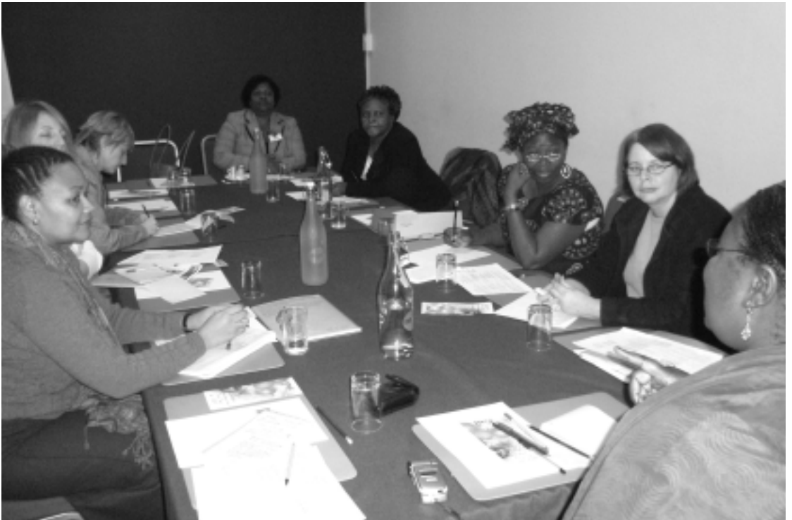
Participantes del Diálogo de Política Justa durante los días de debate en Londres.

El Programa Política Justa de One World Action es parte de nuestro Programme Partnership Agreement (Acuerdo de Asociación de Programas) con el Department for International Development (Departamento de Desarrollo Internacional), Reino Unido