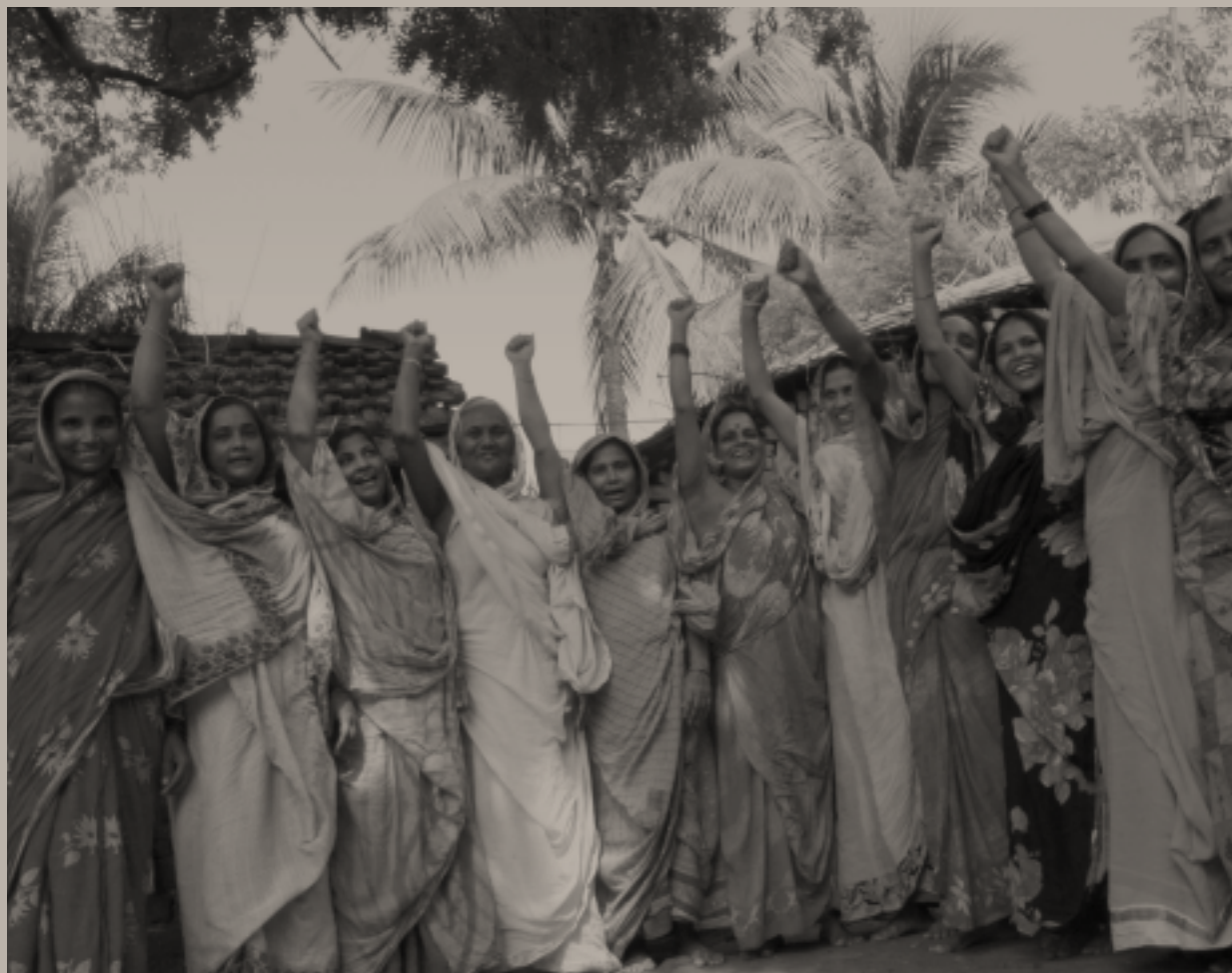
Miembros de organizaciones de mujeres de base en Murshidabad, India